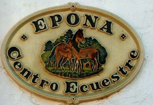
Epona Centro Equestre er fyldt med charmerende detaljer.