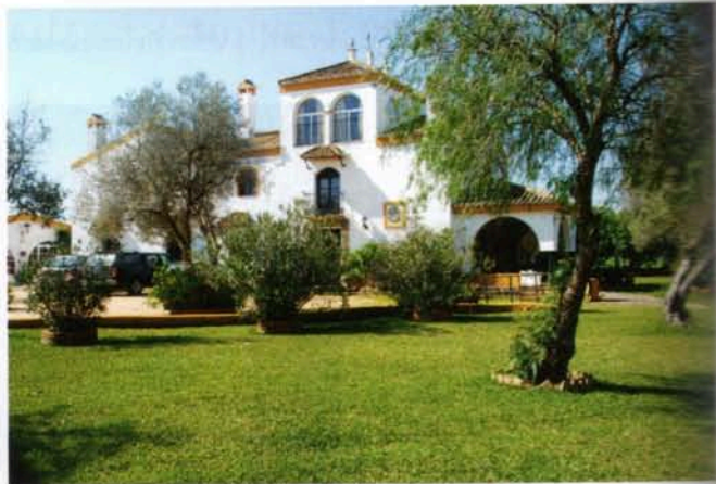
Overalt var indkvarteringsforholdene charmerende og i typisk spansk stil.