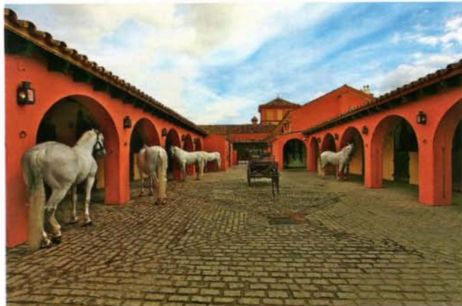
Ordnete forhold og typisk spansk stil.