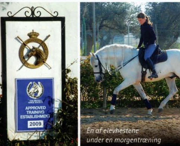
En af elevhestene under en morgentræning

► mere de tur, særligt for de inviterede journalister, var La Hacienda OrAn tæt på byen Sevilla. Her var indkvarteringen i helt nyrenoverede værelser i rustik spansk stil, god traditionel spansk mad og med Spaniens største hestevogsmuseum i en af længerne på gården.